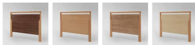
▲ Choco Belle Noce ▲ Hêtre naturel ▲ Havane cerise ▲ Érable royal