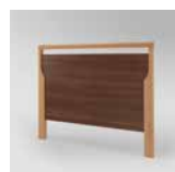
▲ Bella Noce Schoko ▲ Buche Natur