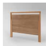
▲ Kirsche Havanna ▲ Königsahorn