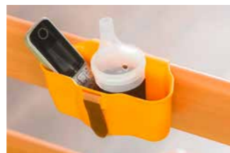
Die Aufnahmeschale für Brillen, Handys oder Pflegeutensilien lässt sich an der durchgehenden Seitensicherung anbringen.