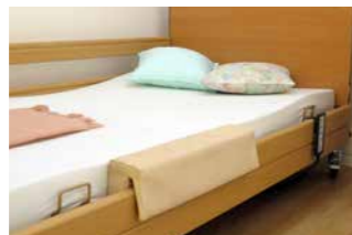
Füllpolster zum Aufstecken auf die durchgehende Seitensicherung.