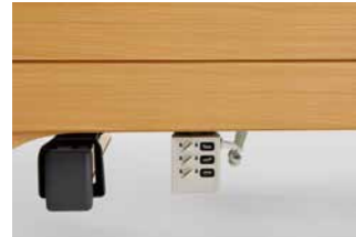
Aufnahme für die Mittelstütze (links) und die Sperrbox (rechts).