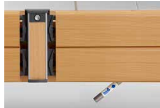
Notabsenkung der Rückenlehne.