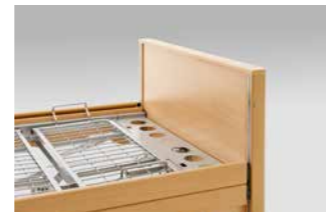
Bettverlängerung inkl. längerer Seitensicherungen und Seitenbretter.