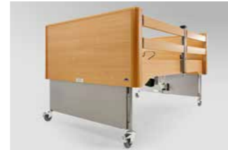
Kunststoffverkleidung der Fahrgestelle für mehr Wohnlichkeit.