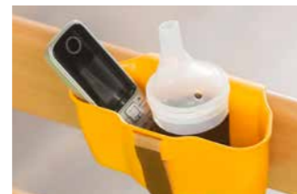
Die Aufnahmeschale für Brillen, Handys oder den kabellosen Handschalter lässt sich an vielen Stellen einfach anbringen.