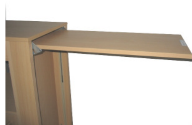
Tischplatte seitlich abschwanken