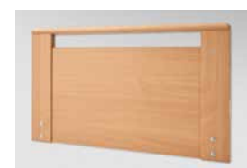
Prinzino mit Griffleiste