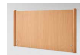
Comodo mit Rundstollen