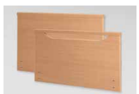
Primus kopfseitig geschlossen, fußseitig mit Griffleiste