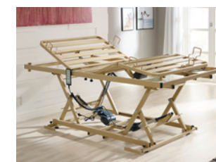
Niedrige Einstiegs- höhe von 29 cm – erleichtert den Ein- und Ausstieg