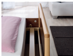
Bettverlängerung (auch nachträglich montierbar)