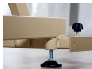
Standfuß mit Bodenausgleichsschraube, Befestigungslasche