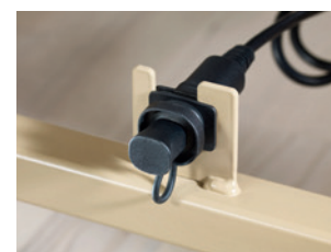
Aufnahmebuchse des Steckers zur Anbindung des elektronischen Schaltnetzteils (Switch Mode)