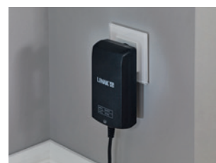
Elektronisches Schaltnetzteil (Switch Mode), direkt hinter Netzstecker integriert (24 Volt-Antriebssystem serienmäßig)