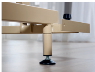
Adaptierbare Standfüße zur Erhöhung der niedrigsten Position (+ 7 cm)